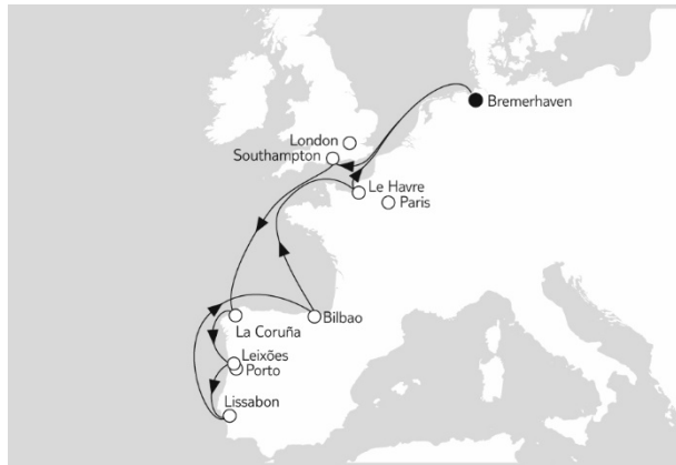
Mein Schiff 3

AKTUELLE FLEX-Preisübersicht aller TUI Cruise Kreuzfahrten finden Sie hier https://www.schiff-ahoi.net/pdf/mein-links01.pdf